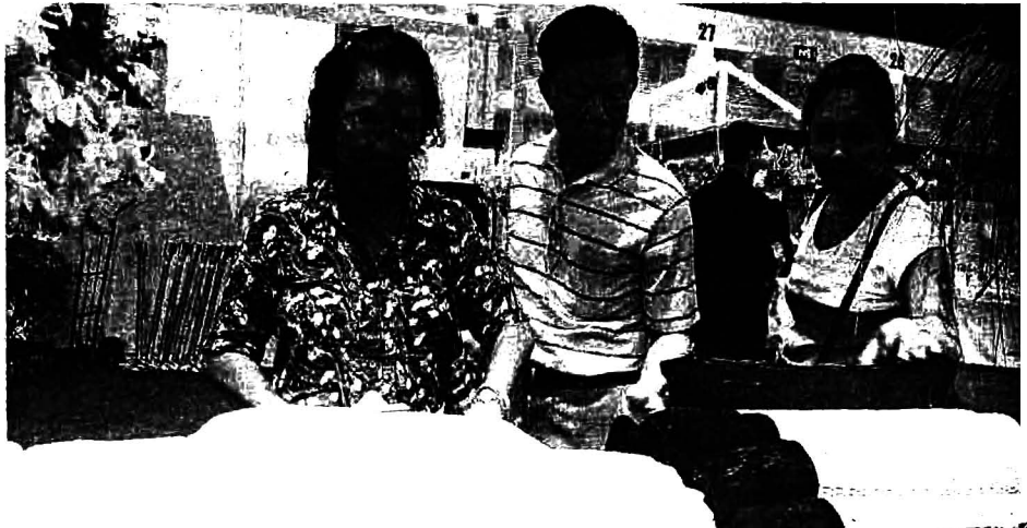
ไปออกบูธที่ไหน ลูกค้าต่างสนใจเข้ามาสอบถาม

มันจะไม่ได้เป็นไอที่อุป ระดับ 5 ดาว ของจังหวัดหนองคาย แต่ก็เป็นที่ดาว เด่นและได้รับความสนใจตลอดเมื่อ ยามไปออกบูธในงานต่างๆ อย่างเมื่อไม่ นานมานี้ ในงานไอที่อุปกลางปี ที่อิมแพค เมืองทองธานี เมื่อบูธของกลุ่มอาชีพท่อเสื้อ เขียวสด บ้านม่วง ตำบลโพนทอง อำเภอโพน